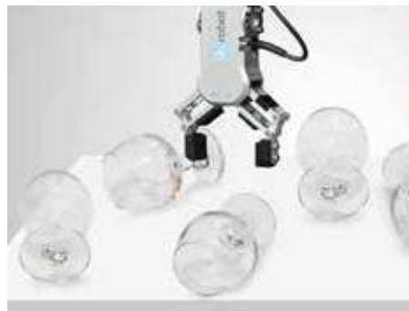
反光、透明或半透明