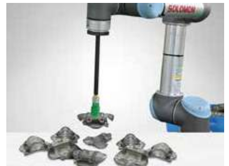
同一物件的各種姿態