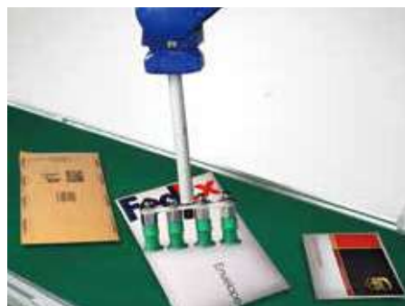
各式各樣物件夾取