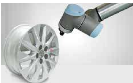
机器人自动路径导引